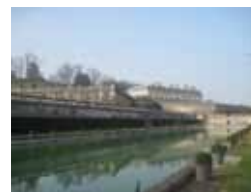
Domaine national de Saint-Cloud (Hauts-de-Seine)