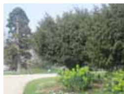
Jardin des Champs Elysées (Paris)