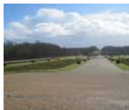
Jardins de Vaux-le-Vicomte à Maincy (Seine-et-Marne)