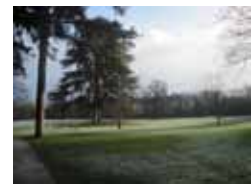
Parc de Boulogne - Edmond de Rothschild à Boulogne-Billancourt (Hauts-de-Seine)