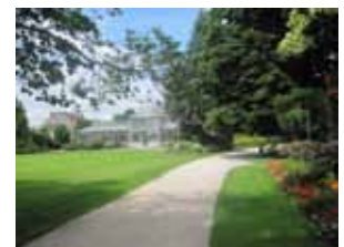
1 - Roseraie Honoré Daumier à Aulnay-sous-Bois (Seine-Saint-Denis)