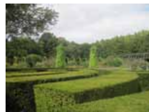
2 - Jardin Massey à Tarbes (Hautes-Pyrénées)