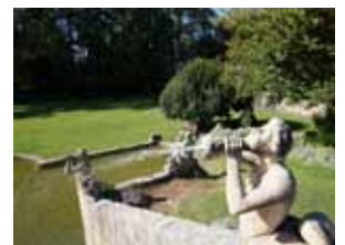
3 - Jardin Renaissance et parc paysager du château-promenade des parfums de Chameroles à Chilleurs-aux-bois (Loiret)