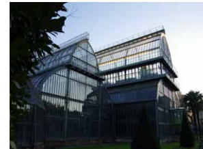
Parc de la Tête d'or à Lyon (Rhône)