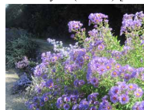
Parc de Bagatelle (Paris) [© Christian Maillard]