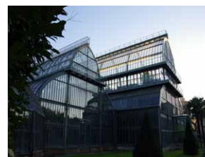
Parc de la Tête d'or à Lyon (Rhône)