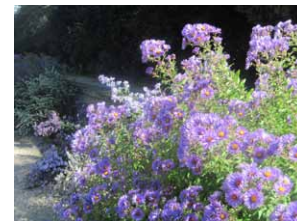
Parc de Bagatelle (Paris)