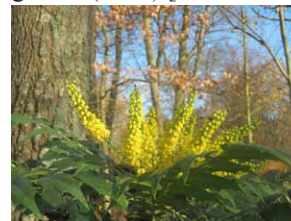
Jardin de Campagne à Grisy-les-Plâtres (Val-d'Oise) [© Christian Maillard]