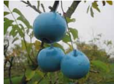
Jardin des Saveurs des jardins fruitiers de Laquenexy (Moselle)