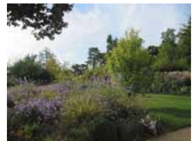
Domaine de Chaumont-sur-Loire (Loir-et-Cher)