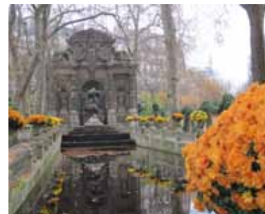
Jardin du Luxembourg (Paris)