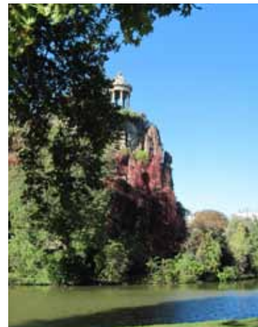
Parc des Buttes Chaumont (Paris)