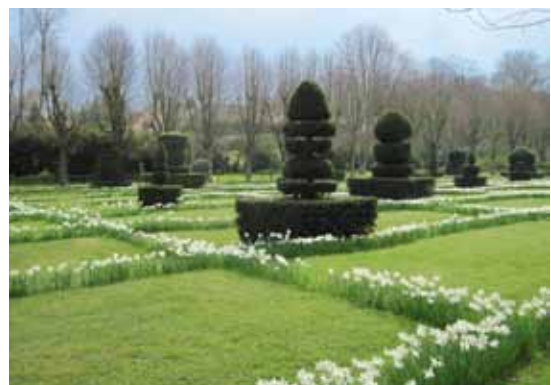
Parc du château d'Ambleville (Val-d'Oise)