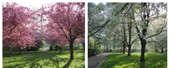
Parc de Sceaux, bosquets Nord et Sud (Hauts-de-Seine) [© Christian Maillard]