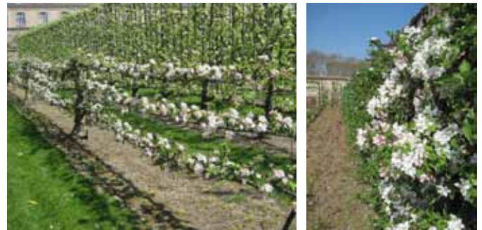
Potager du Roi à Versailles (Yvelines)