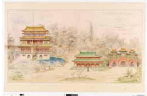
Exposition universelle de 1900, section de l'Empire chinois (Façades principales, élévations coloriées) - Papier, imprimé / Paris, Archives nationales, F/12/4224 (Chine)

Alors que l'exposition universelle de Shanghai (Chine) vient de démarrer le 1 er mai et durera jusqu'au 31 octobre, les Archives nationales proposent jusqu'au 28 juin une exposition pour revenir sur « les expositions universelles et les cultures extra-européennes. France, 1855-1937 ». Ces événements, véritables « machines à rêver » du monde occidental, sont présentés sous le signe du cosmopolitisme en proposant aux visiteurs des visions d'ailleurs, exotiques, au travers de temples égyptiens, musées chinois et autres pyramides aztèques qui ont transformé les paysages du Champ de Mars, du jardin du Trocadéro ou du bois de Vincennes. Près de 200 documents d'archives (plans, gravures, photographies, affiches, textes...) restituent l'ambiance et l'iconographie diffusée à l'époque.